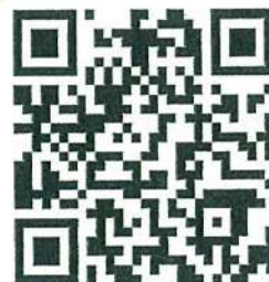
個人情報の保護について