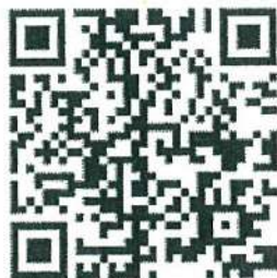
講座利用の手引きについて

同意欄の内容につきましては下の2つの二次元コードにあります 必ずお読みいただき同意いただける場合は□にレ点を入れてください